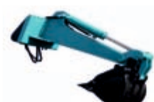
Podkop 574 x 1492 x 1420 mm váha: 95 kg