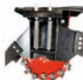
Fréza na pařezy* šířka: 942 mm průměr disku: 506 mm váha: 156 kg