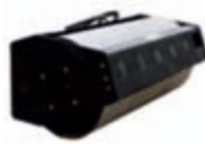
Vibrační válec šířka: 910 mm váha: 380 kg