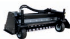
Rotační hrábě záběr: 1220 mm úhel natočení: 25° váha: 262 kg