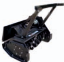
Lesní fréza** záběr: 704 mm