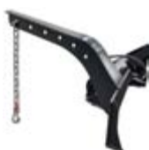
Jeřábové rameno výška: 617 mm váha: 40 kg