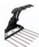
Drapák vidle na seno 1136 x 688 x 1105 mm váha: 138 kg