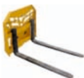
Vidle** 832 x 1070 x 919 mm váha: 150 kg