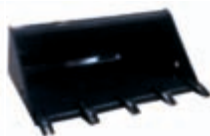
Lopata se zuby** šířka: 1218 mm, 0,2 m 3 váha: 95 kg