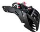
Drapák kořen. hrabě 1168 x 698 x 583 mm váha: 135 kg