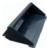
Standartní lopata** šířka: 1218 mm, 0,2 m 3 váha: 103 kg