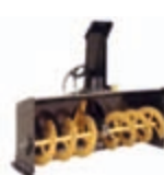
Sněhová fréza 1320 x 812 x 1422 mm váha: 190 kg