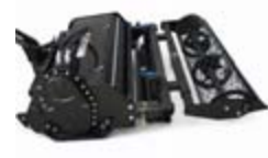
Půdní kultivátor záběr: 1 m hloubka: 120 mm váha: 322 kg