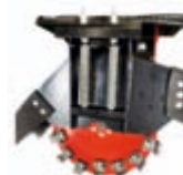
Fréza na pařezy** šířka: 674 mm průměr disku: 506 mm váha: 140 kg