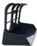
Drapáková lopata 110 x 900 x 575 mm váha: 136 kg