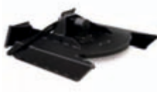
Křovinořez záběr: 1094 mm váha: 190 kg