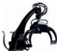
Rotační klip na klády s motorem nosnost: 640 kg váha: 118 kg