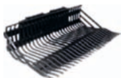
Katrovací lopata 1250 x 690 x 362 mm váha: 98 kg