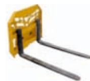
Vidle* 958 × 1537 × 919 mm váha: 230 kg