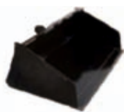
Lehká lopata 1100 x 600 x 500 mm váha: 79 kg