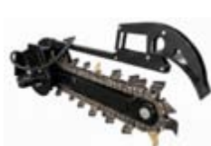
Rýhovač max. hloubka: 1067 mm váha: 238 kg